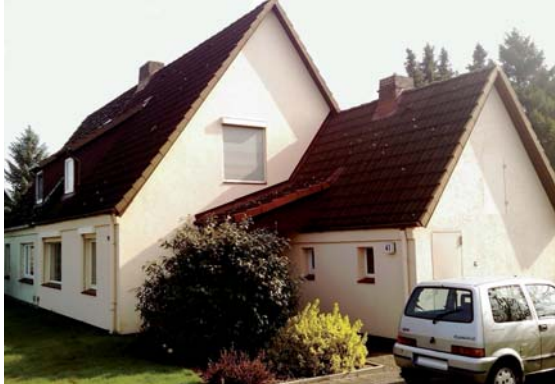
Vor der Modernisierung: das deutsche Model Home im Jahr 2009